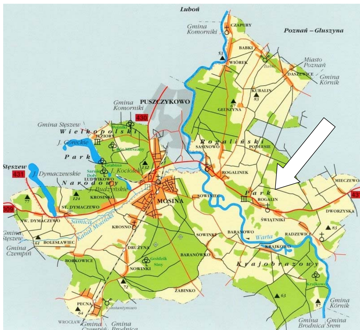
Rysunek 2.1. Położenie Sołectwa Rogalin na tle Gminy