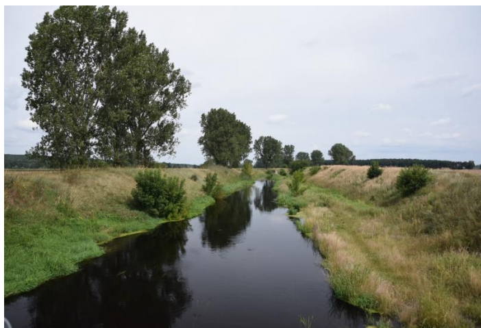
Fot. 5. Zadrzewienia wzdłuż Samicy Stęszewskiej