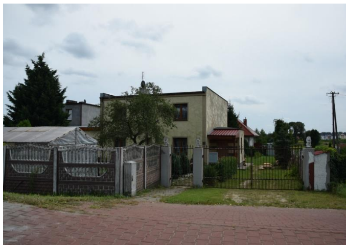
Fot. 3. Zabudowa zlokalizowana przy ul. Wierzbowej