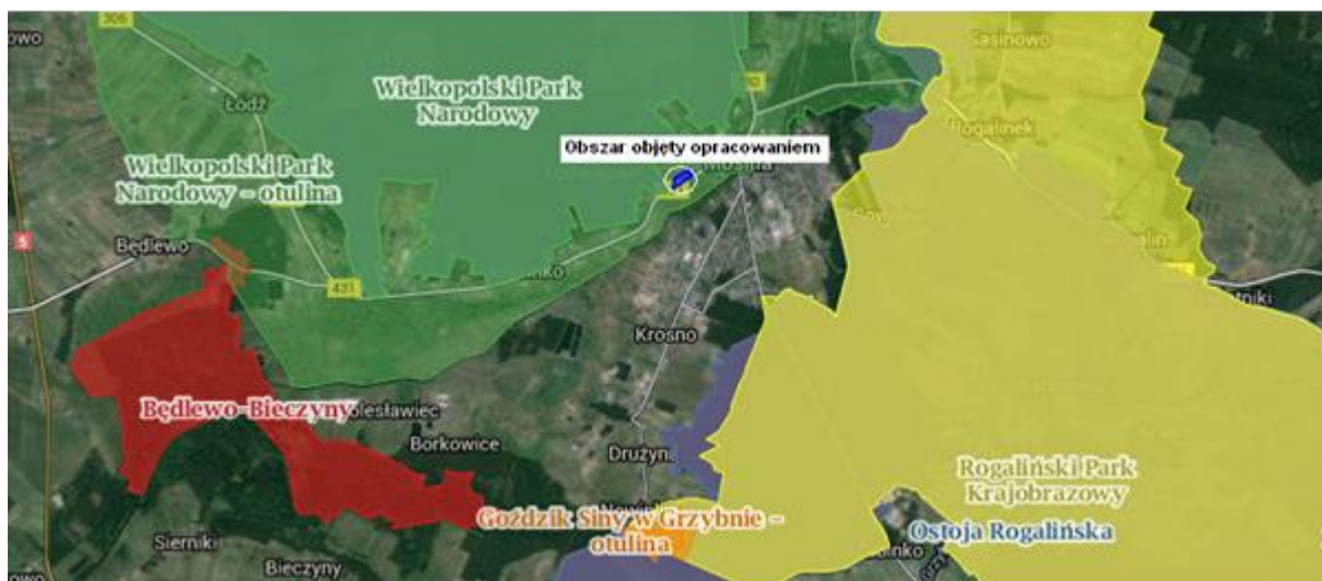
Rysunek 2 Analizowany obszar na tle obszarów chronionych