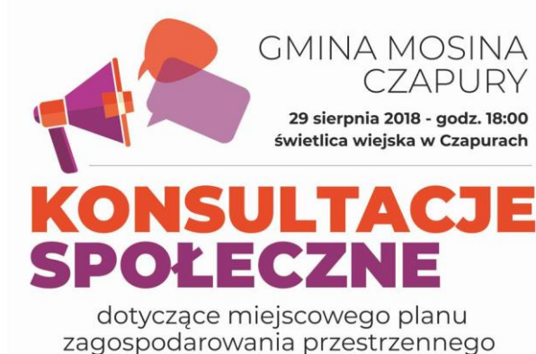
Ryc. 1. Plakat informujący o spotkaniu konsultacyjnym