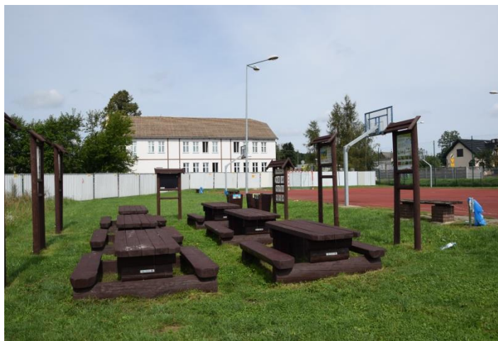
Fot. 1. Widok na tereny sąsiadujące z budynkiem szkoły