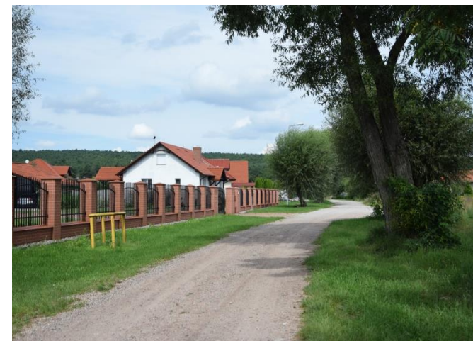
Fot. 3. Zabudowa zlokalizowana przy ul. Wierzbowej