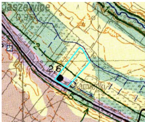
Ryc. 3. Lokalizacja obszaru objętego projektem planu na tle mapy hydrograficznej