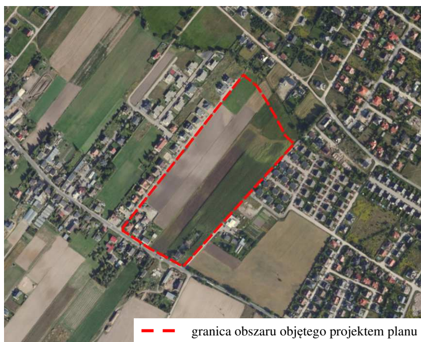
Ryc. 1. Lokalizacja obszaru objętego projektem planu na tle ortofotomapy

Obszar objęty opracowaniem zlokalizowany jest w miejscowości Daszewice w rejonie ulic: Poznańskiej i Klonowej. Jego powierzchnia wynosi ok. 8 ha. Większość analizowanego terenu jest niezabudowana, użytkowana rolniczo. Jedynie wzdłuż ulicy Poznańskiej występuje zabudowa mieszkaniowa jednorodzinna (Ryc. 1.). Przez obszar objęty projektem planu przebiega napowietrzna linia elektroenergetyczna średniego napięcia 15 kV. W ciągu ulicy Poznańskiej i Klonowej, przebiegającej wzdłuż granic opracowania, funkcjonuje sieć wodociągowa i kanalizacji sanitarnej. Analizowany teren sąsiaduje od północy z terenami zieleni krajobrazowej wyznaczonymi w obowiązującym miejscowym planie dla terenów części wsi Daszewice, od wschodu z Osiedlem Azaliowym – zabudowa mieszkaniowa jednorodzinna wraz z zabudową usługową (mechanika samochodowa) w Kamionkach, gmina Kórnik, od południa z ul. Poznańską w Daszewicach, przy której (po południowej jej stronie) występuje zabudowa mieszkaniowa jednorodzinna i usługowa, od zachodu z zabudową mieszkaniową jednorodziną. Wzdłuż południowej granicy opracowania przebiega droga powiatowa nr 2461P - ulica Poznańska.