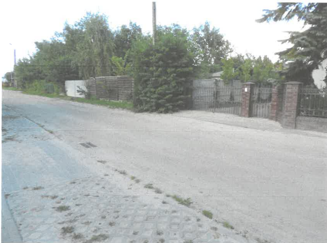
Miejsce gromadzenia dużej ilości wody opadowej wymagające budowy jeszcze dwóch zbiorników gromadzących wodę deszczową.