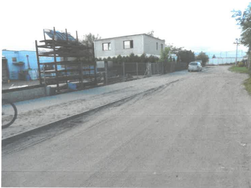
„wyjeżdżony” chodnik przed zakładem produkcyjnym ul. Podgórna