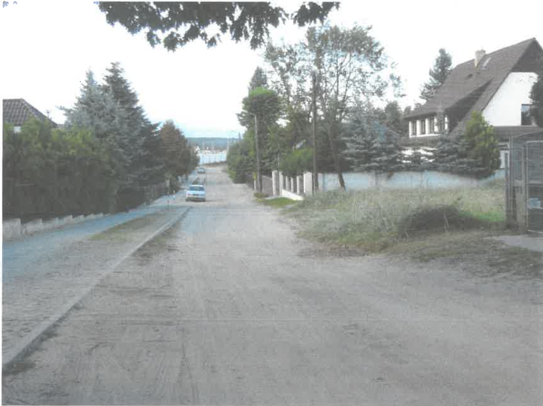
Widok na odcinek ul. Podgórnej do utwardzenia „z górki”.